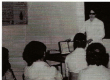
Charlas y Conferencias en nuestra Institución.

Este Material Educativo Tiene por Objeto: Ser de utilidad para Usted, su Familia y la Comunidad